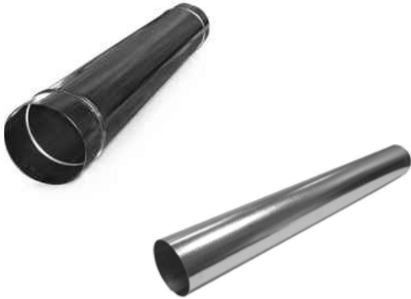
Размеры и технические характеристики