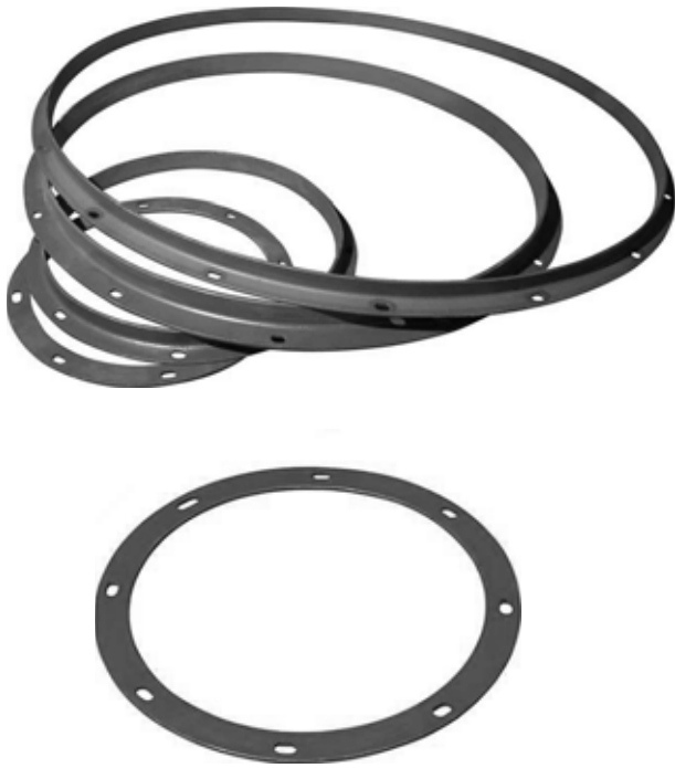
Фланцы круглого сечения диаметрами от 315 до 1250